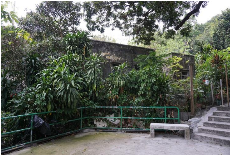
圖十一：黃永玉故居

著名畫家黃永玉與太太於 1948 年來港，曾住在九華徑村 23 號二樓的板間房，同住二樓的作家或畫家，包括沈曼若、陸志庠、楊太陽、李嶽南、考蒂克、端木蕻良、方成、朱鳴岡和單復，而樓適夷、張天翼和巴人（王任叔）則住在一樓。 23