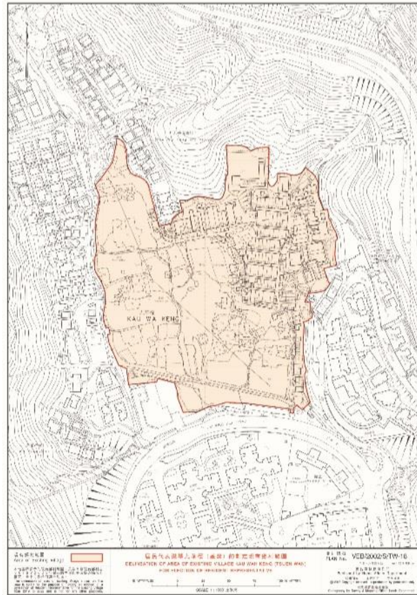
地圖一：居民代表選舉九華徑（荃灣）的劃定現有鄉村範圍

（資料來源：民政事務總署，〈九華徑〉， https://www.had.gov.hk/rre/images/village_map1922/S/s-tw-18.pdf [瀏覽日期：2018年12月20日]）