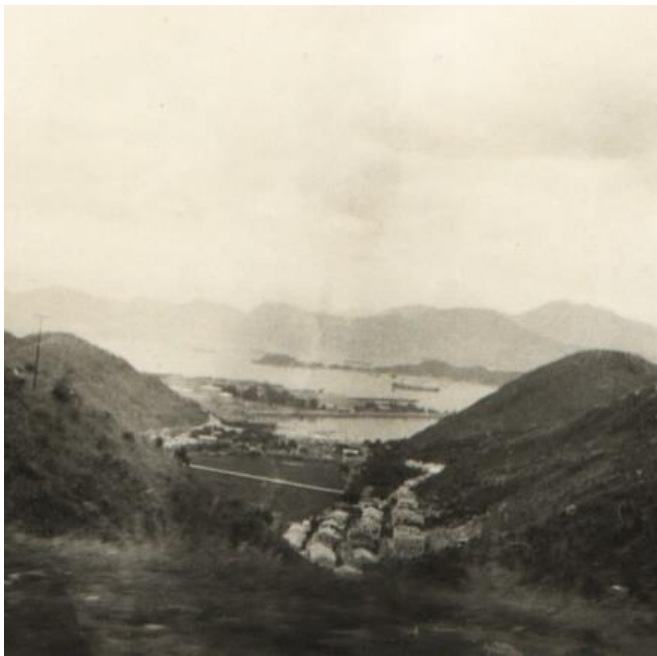
圖一：1940年代的九華徑

九華徑範圍包括九華徑舊村、九華徑新村、長坑村、荔灣花園、華豐園、華荔邨及荔欣苑。根據香港特別行政區地區行政分區，九華徑隸屬葵青區，而其地理位置與深水埗區接壤，村民日常與深水埗區息息相關。根據香港地方議會分區，九華徑舊村北至青山公路（葵涌段），南至荔景山道，東西兩面，分別是鍾山臺和九華徑新村（見地圖一）。九華徑新村北至青山公路（葵涌段），東與九華徑舊村相連，南至荔景山道，西面為斜坡。（見地圖二）