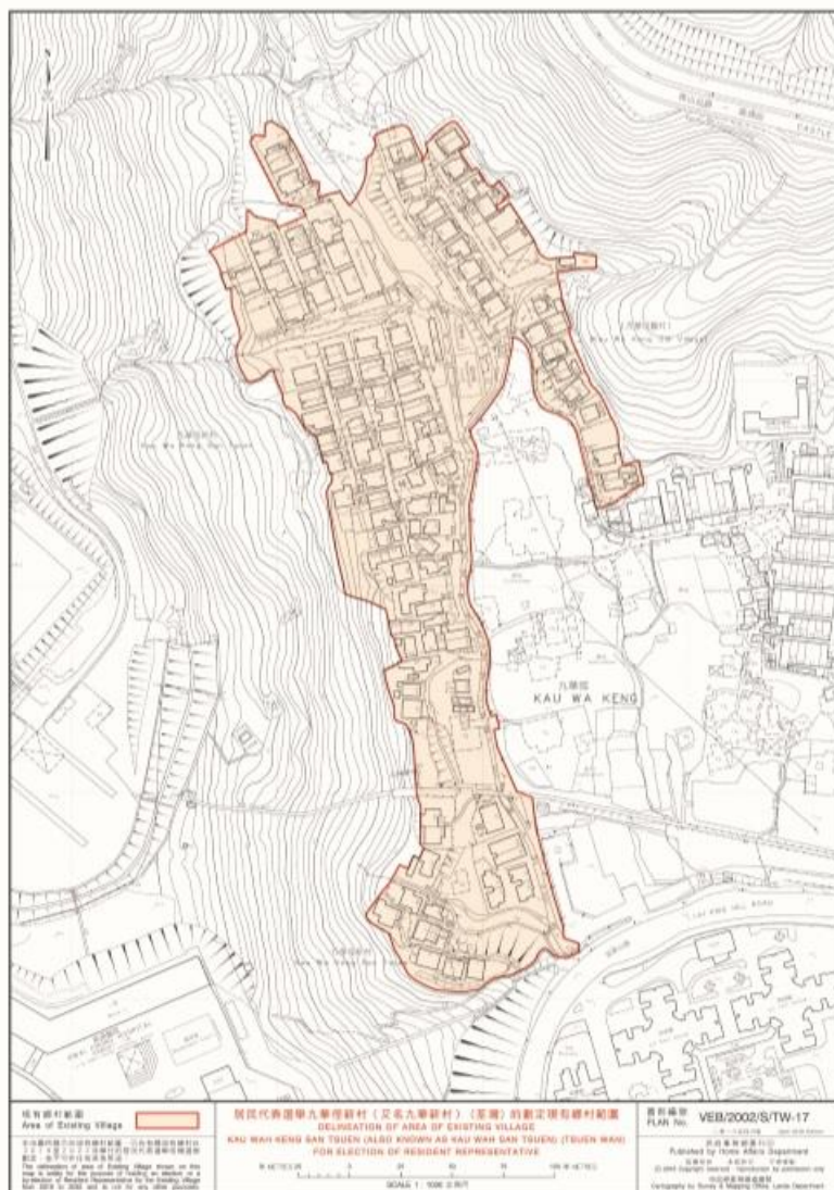
地圖二：居民代表選舉九華徑新村又名（九華新村）（荃灣）的劃定現有鄉村範圍