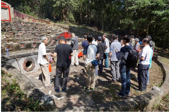
圖十四：秋祭

位於前往養正學校梯級旁的「大王爺神位」是九華徑舊村的土地公，村民相信能守護村落的安寧。村落常見的土地公，是最多村民敬拜的地方保護神，亦稱為大王爺、社稷、大伯公、后土等。根據中國傳統，土地公的正式名稱是「福德正神」，客家人稱「伯公」或「福神」。在中國傳統文化裡，祭祀土地神即祭祀大地，具有保平安、保收成之意。九華徑舊村的「大王爺」是村民拜祭的自然神祇，設有石壇，壇上的神位置有代表土地公的石碑。