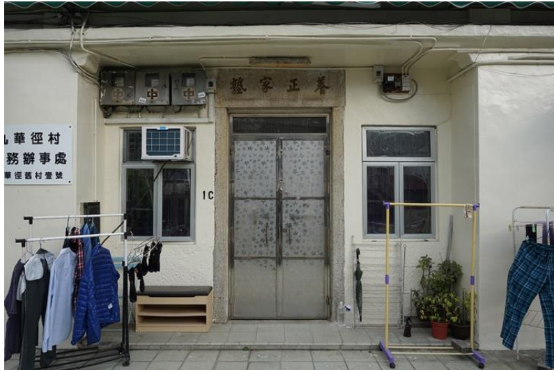
圖六：養正家塾

一， 1971 年，養正家塾由新落成的養正學校取代，校舍自始一直空置至 1990 年代中葉。養正家塾校舍現以改作住宅用途。此外，九華徑舊村村公所自 2003 年初開始，亦設立於養正家塾內。