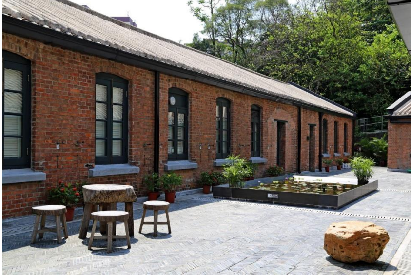
圖四：饒宗頤文化館

《活化歷史建築伙伴計劃》中的首批活化項目，2009 年由香港中華文化促進中心重新規劃及展開活化工作。