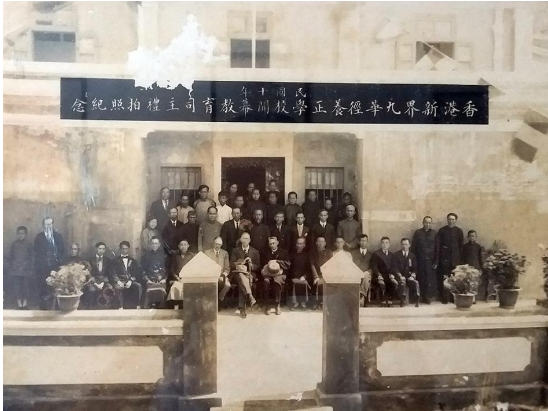
圖十：養正學校（九華徑舊村村公所藏品）

認可。課程設有英語、地理和體育等等，當中更是首間教授英語的政府津貼校。1971年，養正學校遷往新落成的校舍，原校址現改作住宅和村公所。