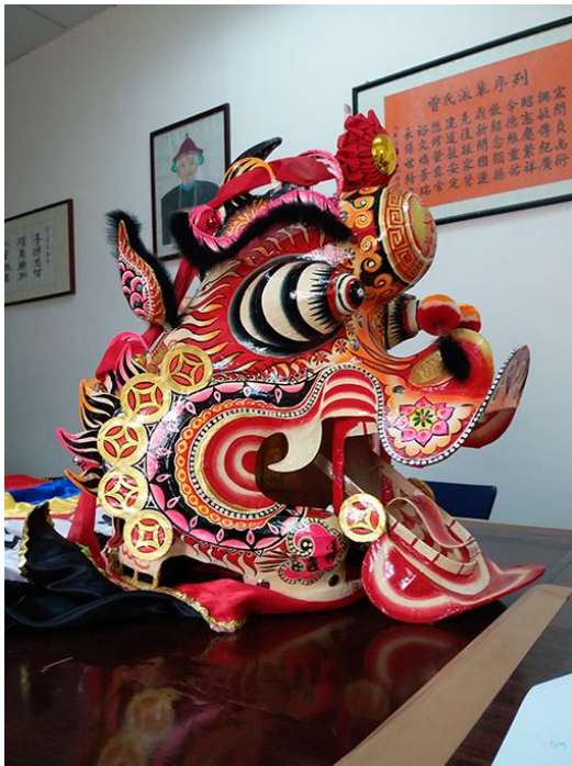
圖十二：麒麟

麒麟的形象是龍頭、鹿身、羊蹄和牛尾，頭上一隻大角。傳說麒麟可以辟邪，故每逢節慶、婚嫁、祠廟開光或新居入夥，客家村民落都會舞麒麟助慶，祈求風調雨順、瑞氣盈門。