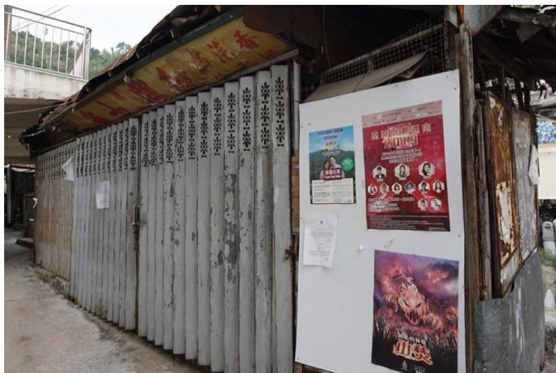
圖九：因被視為違規僭建物，而等待清拆的和興士多（周家建博士提供）