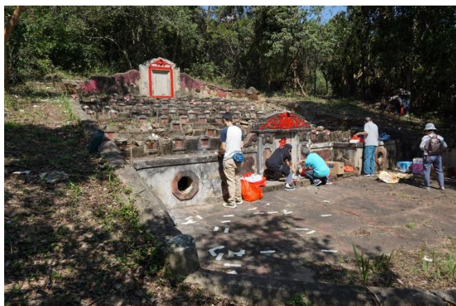
圖十三：九華徑舊村祖墳

九華徑舊村的祖墳位於海峰花園附近的小山丘，鄰近長坑村。每年秋祭時，九華徑舊村村長及村代表皆會先聘請農林護理公司於秋祭前到祖墳除草。秋祭當天，村民在墓前放置祭品，通常為燒肉、熟雞及水果等。拜祭儀式完畢後，男丁負責焚紙錠、化元寶。祭祀儀式完畢，將分吃祭品。隨着時代變遷，食山頭儀式已從簡，此外，亦改在村公所以食盤菜，俗稱「食山頭」的習俗仍然保存至今，只是地點改變而已。