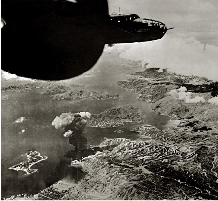
圖二：盟軍空襲美孚石油公司油庫

荔枝角於 1956 年至 1957 年間再度進行填海工程，原位於該處的泳棚被要求遷拆至鄰近港灣。泳會紛紛遷往荔枝角大橋旁下，繼續服務會員及大眾。1960 年代初期，泳會的盛況不再，華員會泳棚於 1961 年解散，到了 1970 年代，只有東方冬泳會繼續運作。1974 年，香港政府在荔枝角灣進行填海工程，用作興建荔枝角公園，整項工程歷時五年，東方冬泳會亦因此遷離該區，荔枝角灣的泳棚歷史亦告終。 5