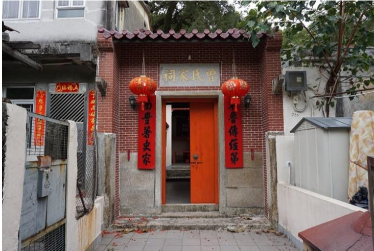
圖八：曾氏家祠

九華徑舊村曾有多間商店在該處營業，為居住於當地的人提供日常所需。（見附表二），當中和興士多（寮屋編號：RTW/4AA/342-343）位於養正家塾前的小路，主要售賣餅乾麵包汽水。中間以小石橋相連。其左邊是一間蕭成記文具店，兩間舖位現已人去樓空，等待清拆。早期九華徑舊村還有一個街市，位置約在九華徑舊村 59 號旁的空地。舊村街市非常興旺，除了固定的商舖，商販來自村外，主要售賣熟食、蔬菜、肉類，還有外來挑著竹籬的小販。隨着地區變遷，舊村街市失去其價值而消失。