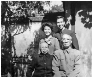
▲一九六一年李女士夫婦結婚時與外公、外婆在北京寓所合照。

調動， ③ 我就從成都到了重慶，上巴蜀中學。這是一個很有名的學校。住在中山三路，公家的房子，有兩個院子。我們住的院子早拆了，旁邊的院子是現在的宋慶齡紀念館。念到了高二，我又因為家裡的工作調動，從重慶來到北京，在第二十三中學念了高三。然後高考考上了北京醫學院， ④ 後來的北京醫科大學學兒科， ⑤ 我先生