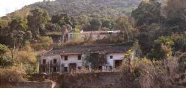
圖：聖家小堂座落在赤徑上圍的山坡

於1867年建成的聖家小堂位於赤徑上圍，鄰近寶田家塾及天水流芳一系列青磚民居建築，小堂建在該村內的一個山坡上，居高臨下俯瞰赤徑口內灣。