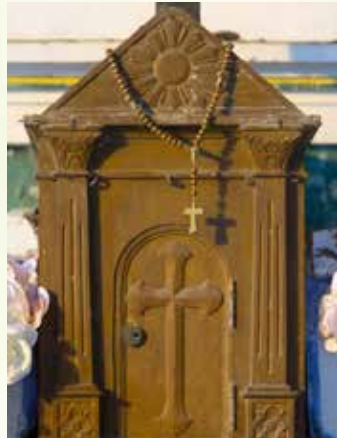
圖：聖家小堂祭台上的聖體櫃

神父前往聖家小堂通常會有一位稱為「伙記」的西貢教友跟隨及擔任搬運工作。除了需要拿著兩籃子的食物、聖經和祭衣外，「伙記」還要肩負起為神父煮食的任務。當他們到達聖家小堂後，「伙記」便會敲響祈禱鐘，提醒村民參加彌撒。村民聽到鐘聲後便會在小堂集合，準備參與彌撒和領聖體。彌撒進行時，男女教友按傳統分開聖堂兩側就坐。在1963年梵蒂岡第二屆大公會議（梵二）前，神父以拉丁文主持彌撒，並以廣東話解釋教義。在梵二後，神父逐漸以廣東話主持彌撒，而村民於禮儀完結後則會在聖體欄杆前辦告解。