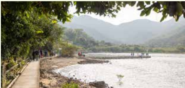
圖：赤徑口內灣，中為小碼頭