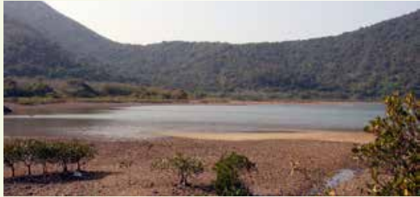
圖：赤徑的泥灘紅樹林生境