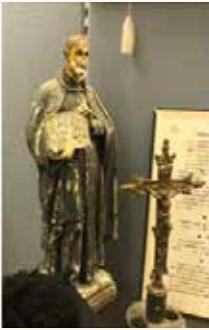
圖：以前安放在 小堂的聖依納爵像 (St. Ignatius of Loyola)

耶穌基督，因為那道成肉身的天主子不僅降生於這個家庭，更在這個家庭裏受到愛的培育。「孩子漸漸長大而強壯，充滿智慧，天主的恩寵常在他身上。」(路2:40)。至於第二個目的，就是提醒我們家庭的價值和重要，勸勉眾信友家庭以聖家作榜樣，活出聖家彼此相愛，彼此共融的精神。