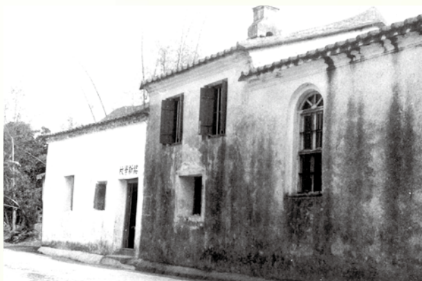
圖：昔日的銘新學校位於神父樓後方，相中可見該入口（1960年12月23日）

赤徑是西貢半島歷史最悠久的古村落之一。根據《新安縣志》，赤徑是客家雜姓村，距今已超過二百年歷史。村民包括趙、李、范、鄭及黃等姓氏，當中趙姓先祖從廣東東莞石龍唐頭廈遷到赤徑居住，是為最早於赤徑定居的氏族，居於赤徑上圍，而李、范、鄭及黃氏族人則相繼於下圍定居，早期村民皆以務農為生。