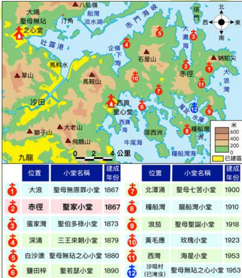
圖：赤徑聖家小堂及其他西貢歷史小堂的地理位置