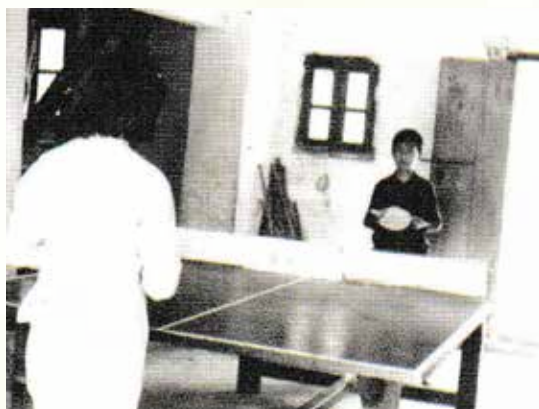
圖：原銘新學校內兩名學生在玩乒乓球