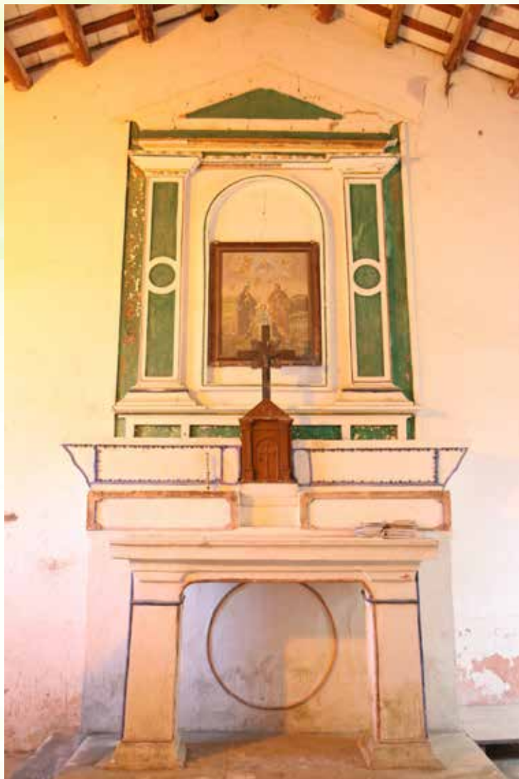
圖：聖家小堂的梵二前祭台（大埔聖母無玷之心堂攝於2007年）