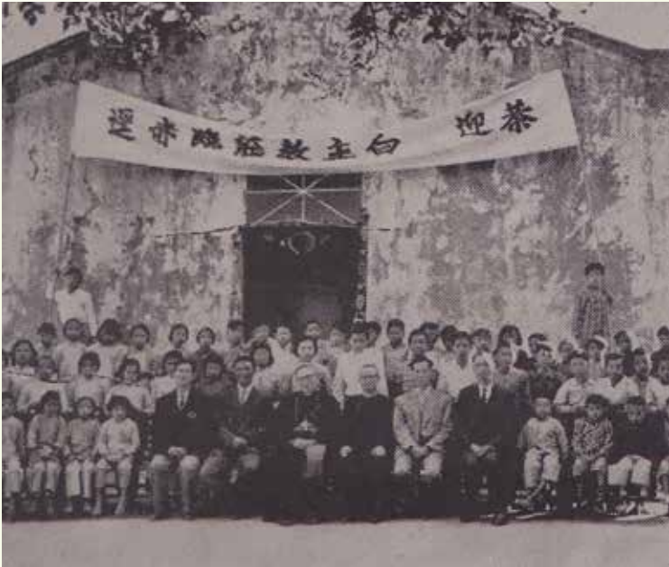
圖：1960年12月白主教與赤徑村民於堅振禮後合影

1946年底，神父恢復到西貢傳教。1950年代末，聖家小堂的教友人數約有250人。1960年12月，白英奇主教(Bishop Lorenzo Bianchi, PIME, 1899-1983)親自前往離島、大埔及西貢的村落，當中白主教為30名赤徑村民施放堅振。