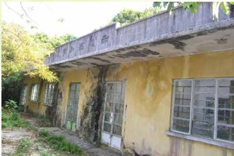
圖：已荒廢的赤徑銘新學校