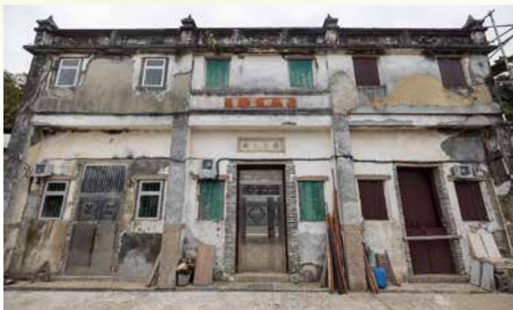
圖：位於赤徑上圍的客家青磚大宅寶田家塾

雖然現在赤徑村甚少村民居住，但聖家小堂仍然得到妥善保存，不時亦會有熱心教友前往小堂進行朝聖。至於村內的其他民居如「寶田家塾」和「天水流芳」等傳統青磚建築的外貌依然保存完整，但經年累月屋內已見殘破。