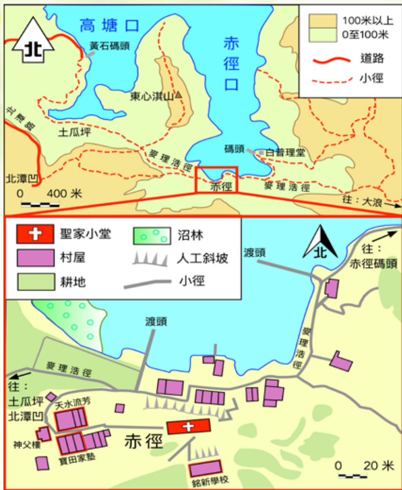
圖：赤徑及聖家小堂位置圖