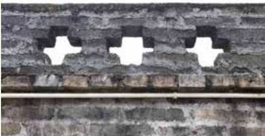
圖：村內的客家民居建築依然保存完整