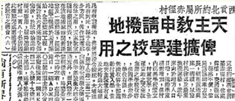
圖：（《華僑日報》，1963年4月17日）

學校只餘下一名老師和五名學生。學校最終於1976年停辦，而校舍亦隨即空置。後來大埔堂區的神父有感空置校舍不是辦法，遂將學校發展為讓青少年宿營的地點，故此在旁邊的空地上現仍可見有燒烤爐及電視機等設施。