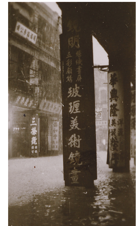
戰前的鏡明，其唐樓石柱上寫上「玻璃美術鏡畫」，可見當年的「嘍」跟今天「鑊」字共通。