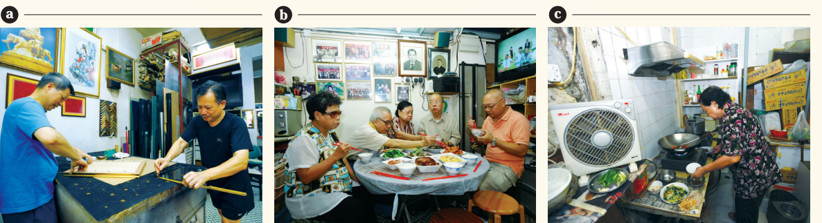
a 工作枱又名工夫枱，是一個有軌的活動平台，供陳老闆兄弟日常工作之用。 b 中庭有充裕的空間，令家人經常能夠聚首一堂，既可開始打麻雀又可開飯，樂也融融。 c 後欄原先的天井，後期加上了上蓋改建成廚房，是陳老太親自下廚的小天地。

不說不知，不少舖原來為了營運，不能依靠單一業務，鏡明自開業以來，一直堅守以玻璃和裝裱畫框為本業，但其間也曾將店面位置租予其他人營生，藉此幫補租金。例如六十年代的天井電鍍工場，到七至八十年代，舖前兩旁曾租予他人作賣衣物和找換店，後期更有售賣玻璃魚缸和玻璃罩，曾為店舖帶來利潤。總而言之，與時並進，善用空間，靈活變通，已成了小本經營者的生存之道。陳老闆坦言，這裏是凝聚家人朋友維繫感情的好地方，名副其實的一家店。