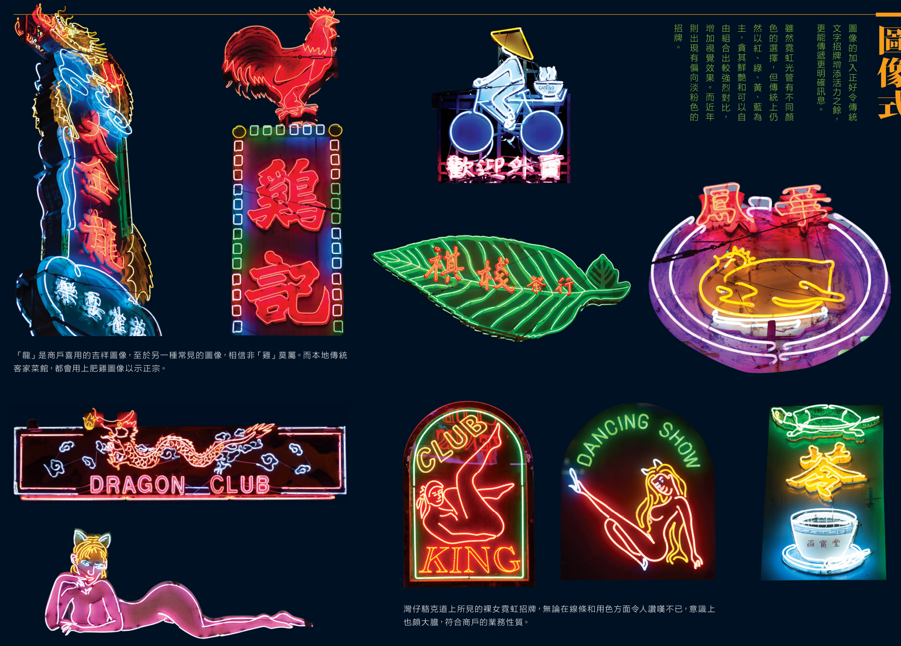
「龍」是商戶喜用的吉祥圖像，至於另一種常見的圖像，相信非「雞」莫屬。而本地傳統客家菜館，都會用上肥雞圖像以示正宗。

雖然霓虹光管有不同顏色的選擇，但傳統上仍然以紅、綠、黃、藍為主，兼具鮮艷和可以自由組合比較強烈對比，增加視覺效果，而近年則出現有偏向淡粉色的招牌。