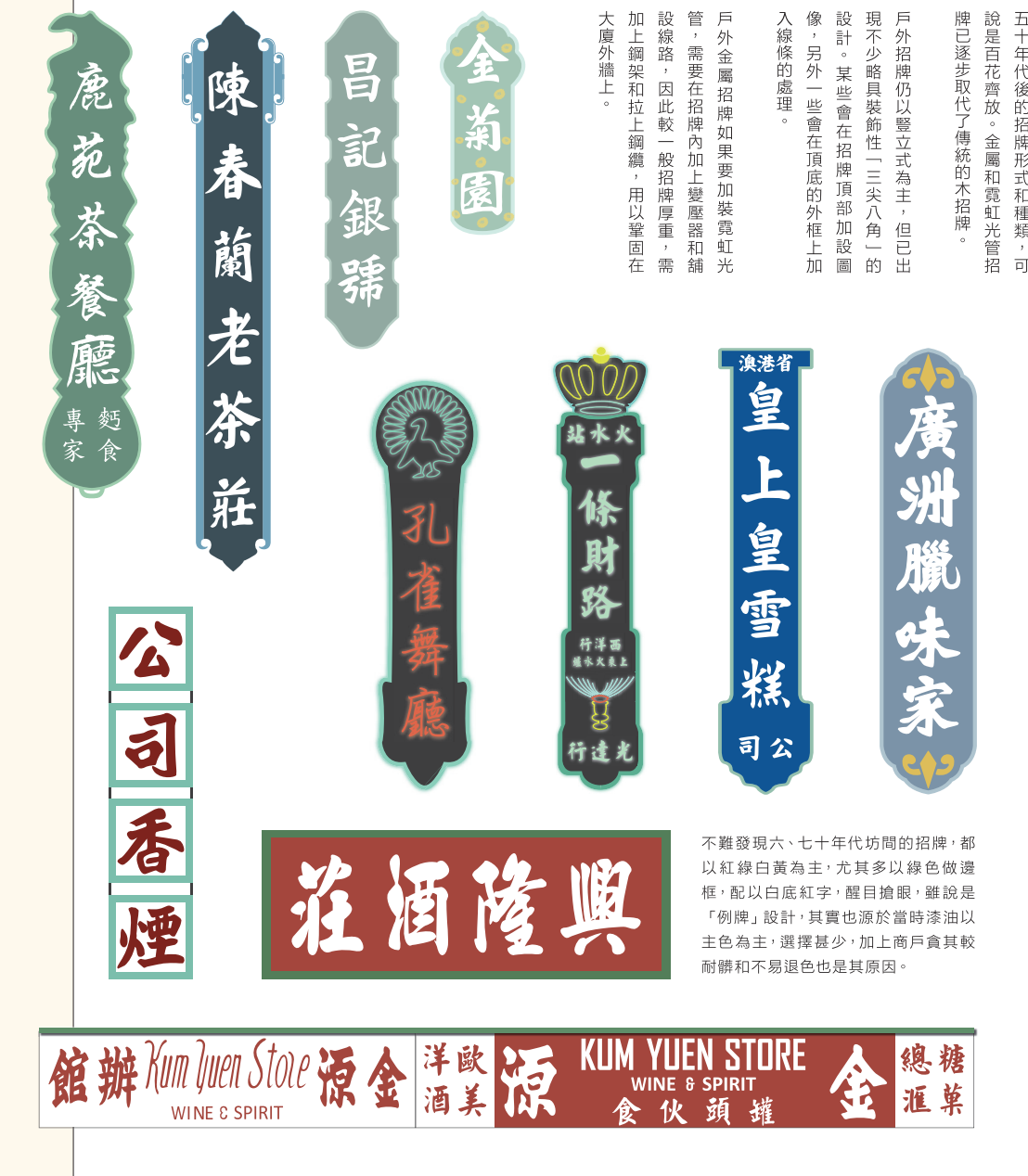
不難發現六、七十年代坊間的招牌，都以紅綠白黃為主，尤其多以綠色做邊框，配以白底紅字，醒目搶眼。雖說是「例牌」設計，其實也源於當時漆油以白色為主，選擇甚少，加上商戶貪其較耐曬和不退色也是其原因。

五十年代的招牌形式和種類，可說是百花齊放。金屬和霓虹光管招牌已逐步取代了傳統の木招牌。戶外金屬招牌如果要加裝霓虹光管，需要在招牌內加上變壓器和鋪設線路，因此較一般招牌厚重，需加上鋼架和拉上鋼線，用以鞏固在大廈外牆上。