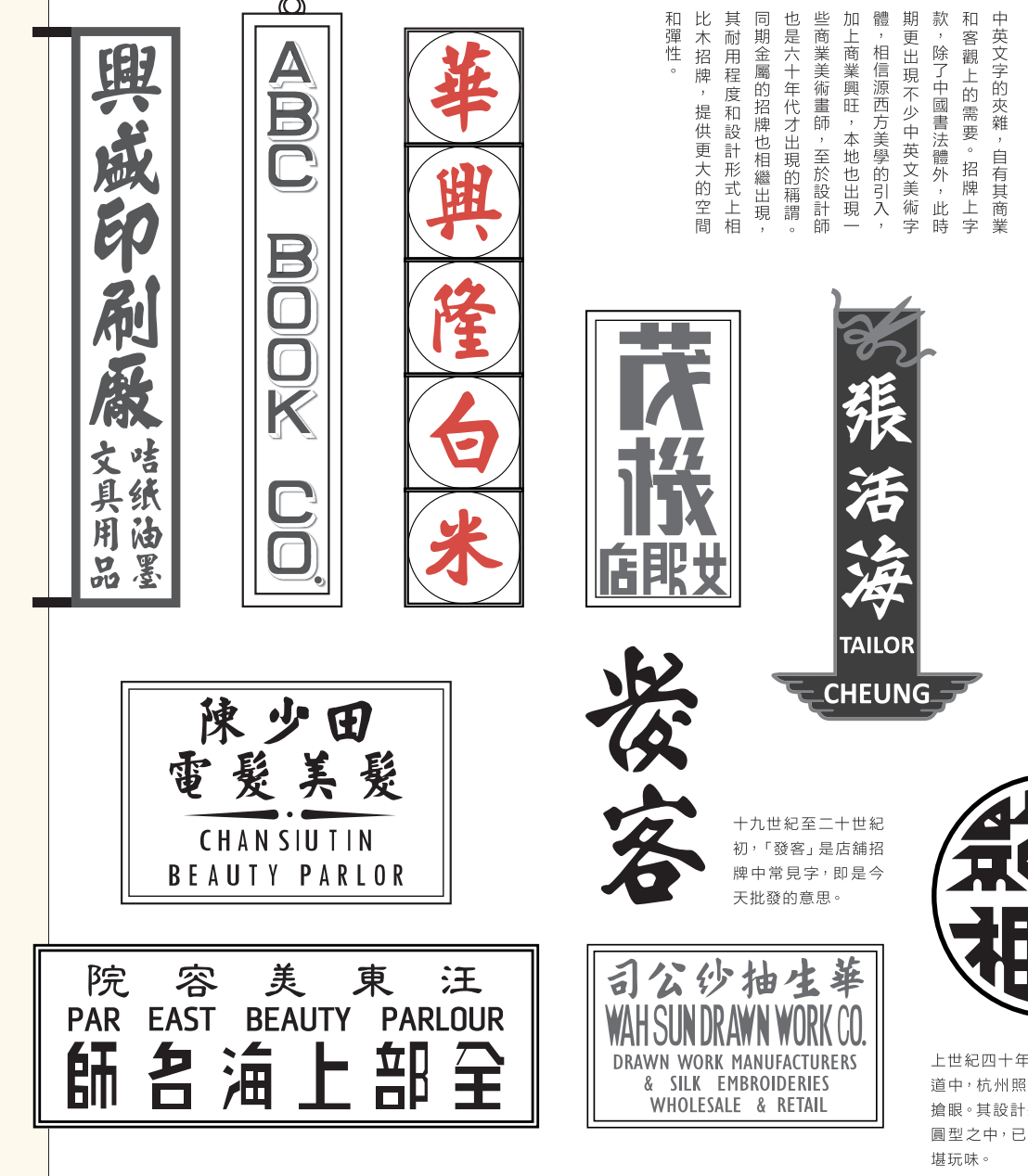
十九世紀至二十世紀初，「發客」是店舖招牌中常見字，即是今天批發的意思。

中英文字的夾雜，自有其商業和客觀上的需要。招牌上字款，除了中國書法體外，此時期更出現不少中英文夾雜字體。相信源西方學藝的引入，加上商業興旺，本地也出現一些商業美術畫師，至於設計師也是六十年代才出現的稱謂。同期豎式的招牌也相繼出現，其耐用程度和設計形式上相比木招牌，提供更大的空間和彈性。